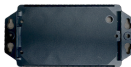
Soporte magnético (opcional)