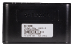
Dispositivo XT inalámbrico